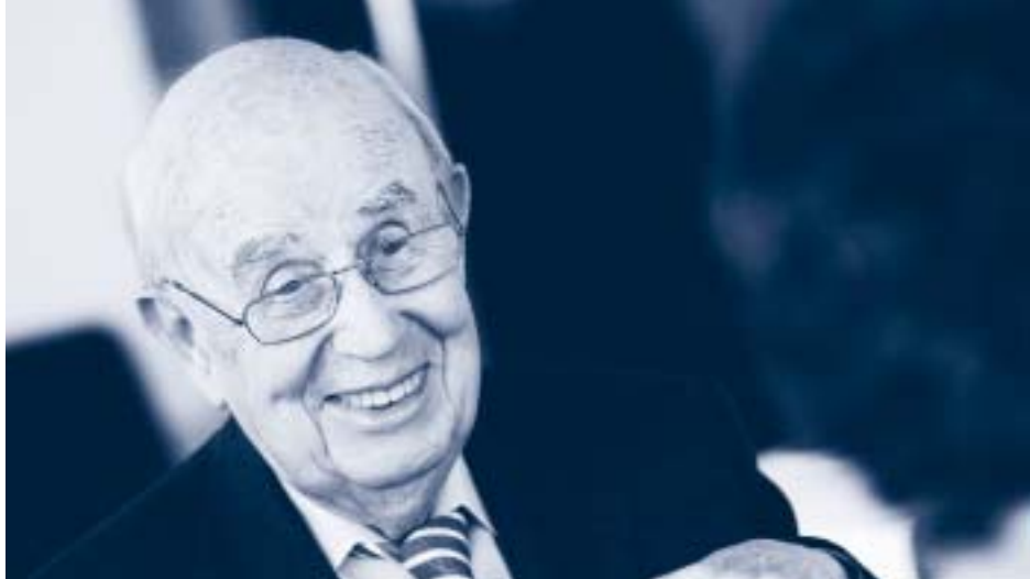
Prof. Dr. Fritz Sennheiser

In einer kleinen Feierstunde bedankten sich am 22. Februar 2005 alle Mitarbeiterinnen und Mitarbeiter sowie die Geschäftsführung in den Räumen des Hospizes bei Sekt, Kanapee und Kaffee ganz persönlich bei Herrn Prof. Dr. Fritz Sennheiser und seiner Gattin für die großzügige Stiftung zu Gunsten des Uhlhorn Hospizes mit einem Kapitalvermögen von 1 Million Euro. Die Zinserträge aus diesem Stiftungskapital, das selbst nicht angetastet werden darf, sondern zu erhalten ist, sollen der Arbeit des Uhlhorn Hospizes zu Gute kommen. Hierdurch wird zukünftig ein weiterer Beitrag